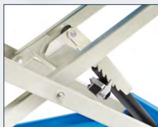
Ausgestattet mit druckluftbetriebener, mechanischer Sicherheitsraststange.