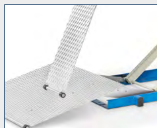
Rutschhemmendes Trapezblech aus Aluminium.